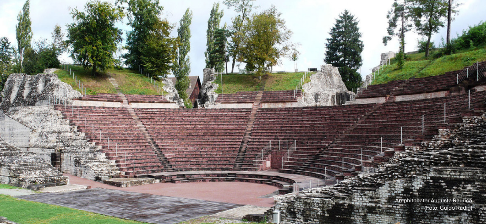
Amphitheater Augusta Raurica