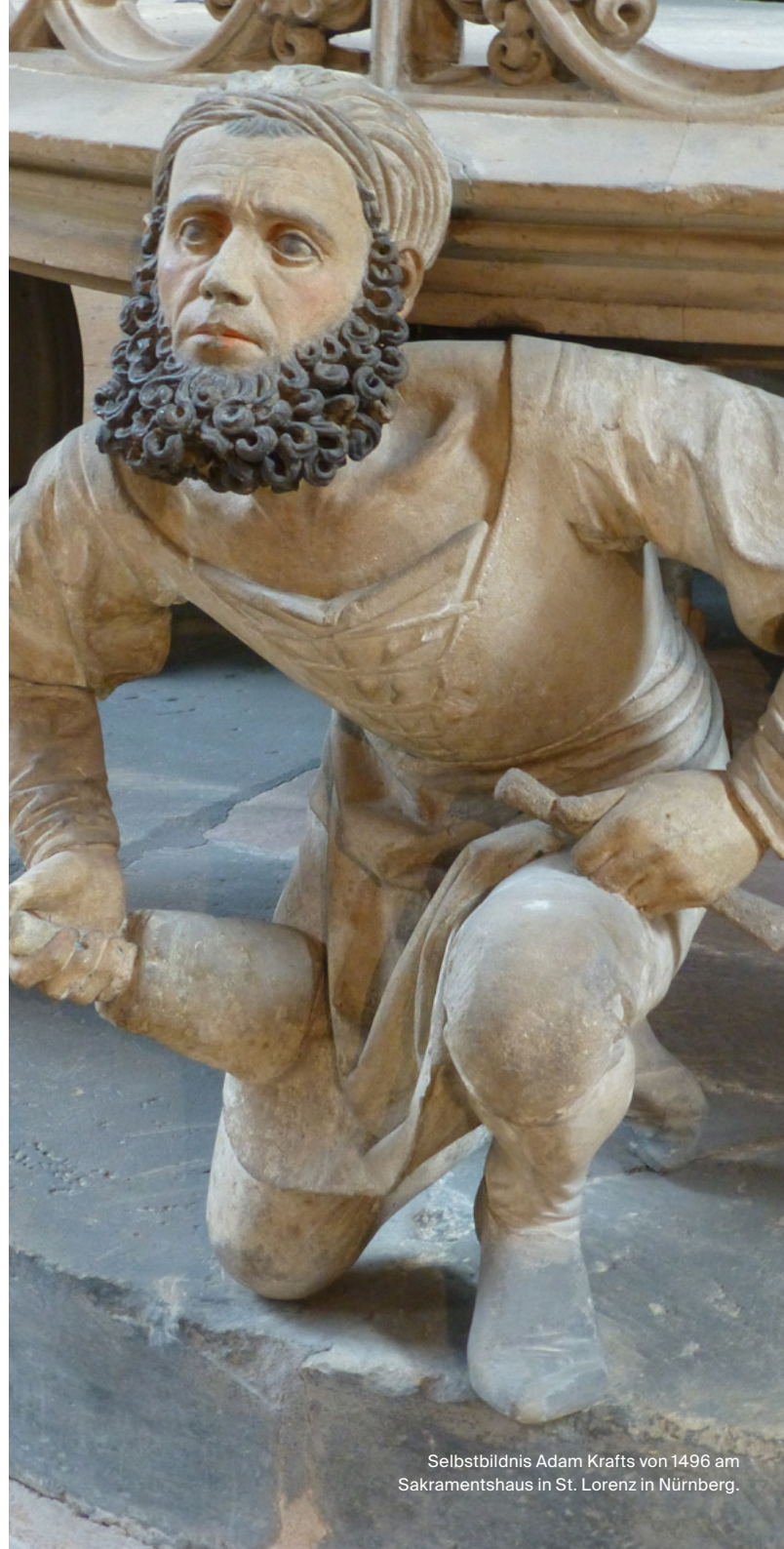
Selbstbildnis Adam Krafts von 1496 am Sakramentshaus in St. Lorenz in Nürnberg.

Im Anschluss bittet der Förderverein des ALM zu einem kleinen Umtrunk, so dass Gelegenheit besteht, mit den Referenten ins Gespräch zu kommen.