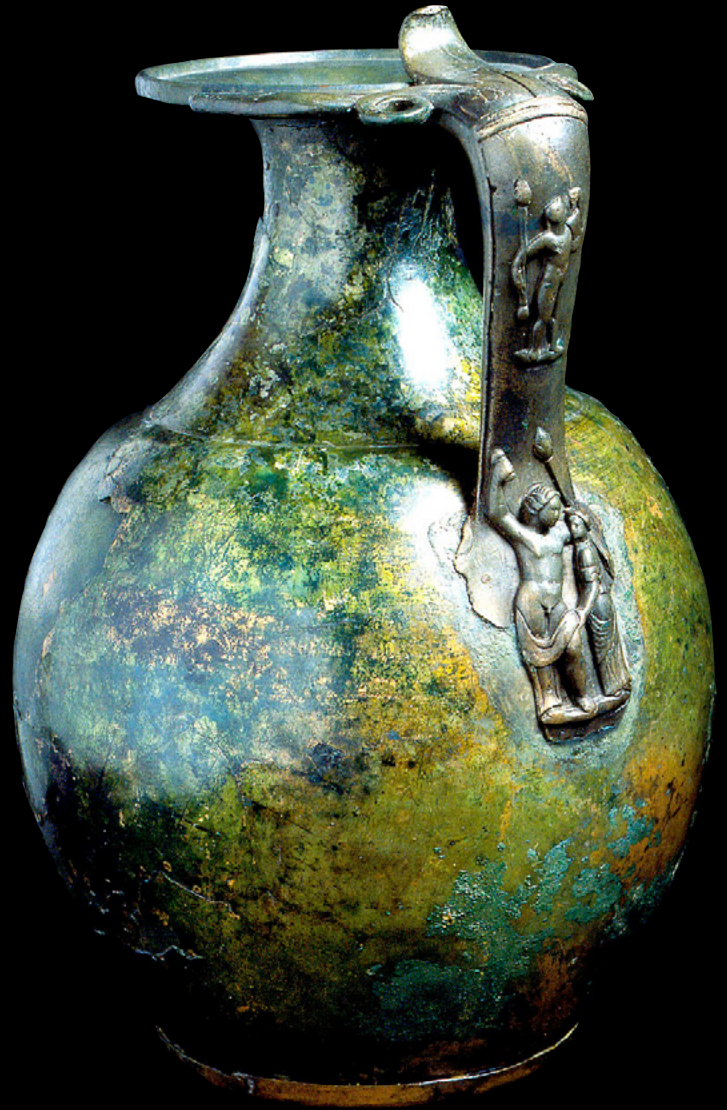
Bronzene Weinkanne mit der Darstellung des antiken Weingottes Dionysos auf dem Kannengriff 2. Jh. n. Chr. aus Waldkirch, Lkr. Emmendingen

19.05. bzw. 16.06. an unserer Kasse oder direkt über unser Online-Ticketing. Mehr Infos unter +49 (0) 7531 9804-43.